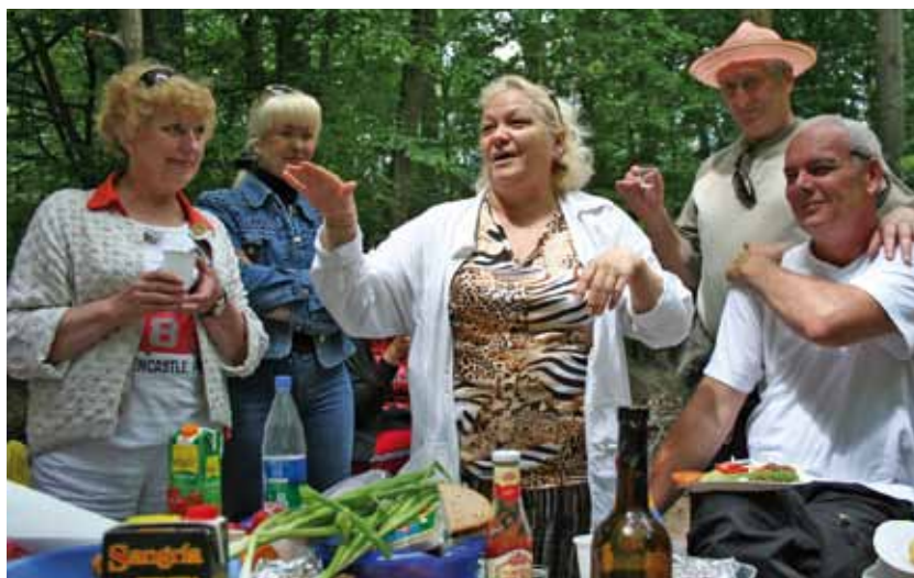
Большой пикник во время поездки в Саксонскую Швейцарию.

Путешествия, экскурсии и вылазки на природу-излюбленный вид отдыха учеников и сотрудников школы „zu Hause“ e.V. Уже традиционными стали поездки в Саксонскую Швейцарию, экскурсии в Чехию, посещения различных городов на автобусе или поезде. Наши учащиеся посещали, среди прочих, такие города как Прага, Лондон, Париж, плыли по Рейну, осматривали город Лаузитц. Участники путешествий всегда радуют вкусная еда и веселая атмосфера. Они узнают много интересных историй о культуре посещаемых стран и городов.