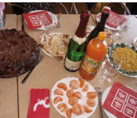
Традиционные блюда и витамины.

Музыкальные занятия дарят положительные эмоции, повышают социальную компетентность, творческое мышление и, конечно, оттачивают владение музыкальными инструментами, будь то пианино, синтезатор или флейта. Благодаря высокому профессионализму педагога, занятия становятся не просто хобби, но и хорошей основой для дальнейшей учебы.