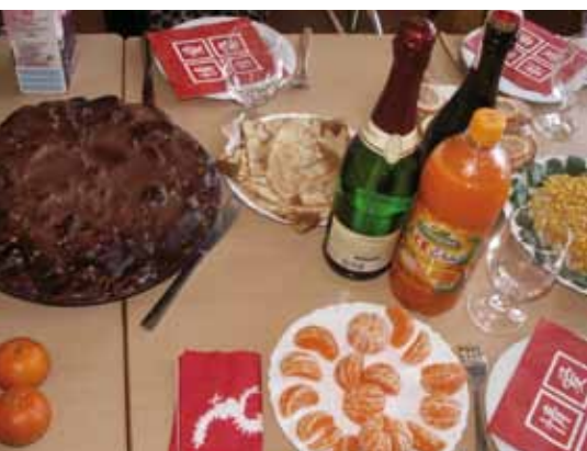
Traditionelle Gerichte plus Vitamine.

Auf den Tischen stehen die traditionellen Gerichte aus der Heimat wie Pelmeni, Piroggen und Blintschiki. Aber auch Gerichte aus anderen Ländern. Schon bei den ersten Klängen der Musik ist die Tanzfläche gefüllt. Jährlich wiederkehrende Feste mit langer Tradition sind der Karneval im Februar, der Sommernachtsball, das Weihnachtsfest und das Neujahrsfest.