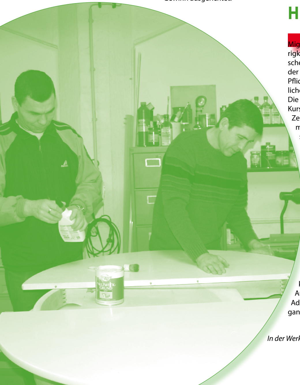
In der Werkstatt.

Adresse: Hohe Straße 9-13, Aufgang B, Zimmer 214