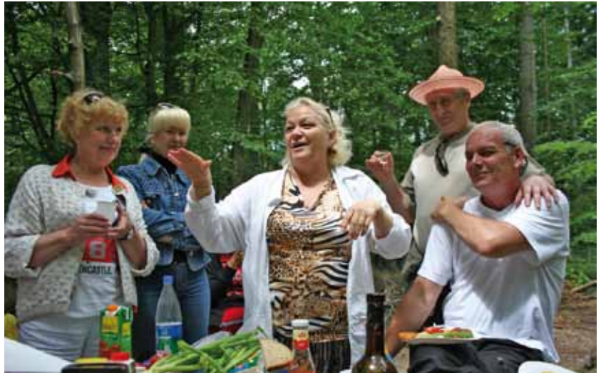
Großes Picknick während einer Wanderung in der Sächsischen Schweiz.

Wandern und Ausflüge in die freie Natur stehen bei den Vereinsmitgliedern und den Teilnehmern der Integrationskurse hoch im Kurs. Tradition haben Wanderungen in die Sächsische Schweiz, Fahrten und Ausflüge nach Tschechien und Städtereisen mit Bus oder Bahn. Unsere Kursteilnehmer besuchten unter anderem Prag, London, Paris, schipperten den Rhein entlang und schauten sich in der Lausitz um. Die Teilnehmer und Teilnehmerinnen genießen jedes Mal die ausgelassene Stimmung und erfahren nebenbei viel Wissenswertes zu Geschichte und Kultur der besuchten Stadt oder Region.